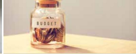
Extra Vlaamse middelen voor Zwalm (p. 3)