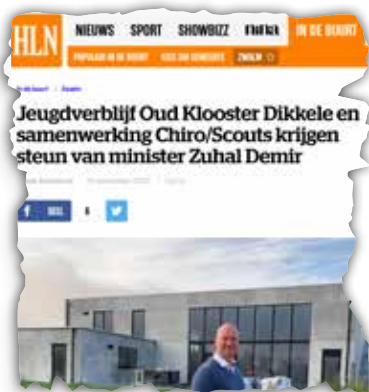
Bron: HLN, 09/09/2020