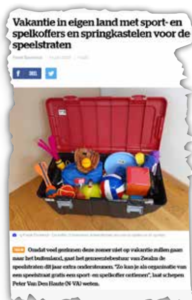
Bron: HLN, 14/06/2020