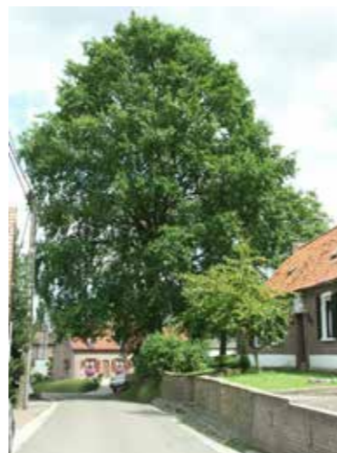
▲ De legendarische eik van Sint-Maria-Latem behoort niet langer tot erfgoed Vlaanderen.

verkoopwaarde van de pastorie door een nieuwbouwproject te vergunnen. In Sint-Maria-Latem moest de iconische eik eraan geloven, nochtans stond ook deze eik op de inventarislijst van erfgoed Vlaanderen. Nu de honderdste ronde van Vlaanderen achter de rug is, hoopt de N-VA dat de kasseien in Roborst eindelijk teruggeplaatst worden, zoals eerder beloofd.