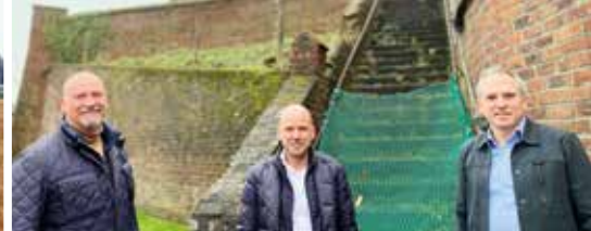
Restauratie van kerkhof in Sint-Denijs-Boekel (p. 3)