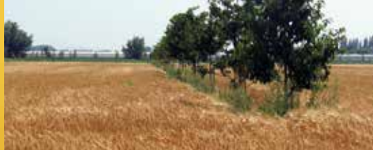
Boslandbouw: een win-winsituatie voor iedereen? (p. 2)