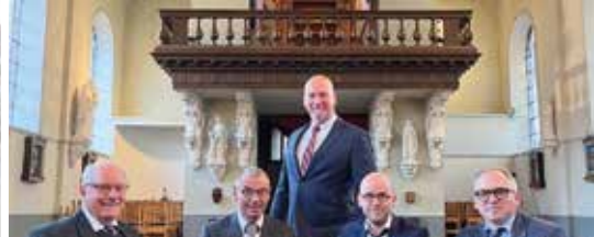
Restauratie orgel Dikkele (p. 3)