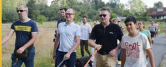
Terugblik op de wandeling met viervoeters (p. 2)