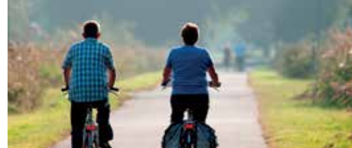
1,45 miljoen euro voor fietsinfrastructuur p. 3