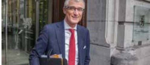
Minister-president Bourgeois reageert p. 2