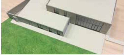
Geld voor Chiro-Scouts p. 2