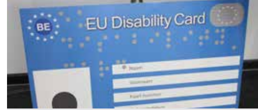
Kaart voor gehandicapten p. 3